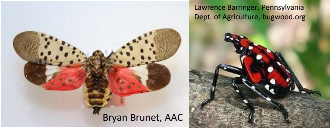
Lawrence Barringer, Pennsylvania Dept. of Agriculture, bugwood.org

Insectes à surveiller et à signaler par toute personne qui surveille, photographie et observe les insectes. Utilisez le code QR pour signaler toutes les observations, y compris les espèces réglementées par l'Agence canadienne d'inspection des aliments (ACIA) .