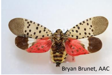
Bryan Brunet, AAC

Insectes à surveiller et à signaler par toute personne qui surveille, photographie et observe les insectes. Utilisez le code QR pour signaler toutes les observations, y compris les espèces réglementées par l'Agence canadienne d'inspection des aliments (ACIA) .